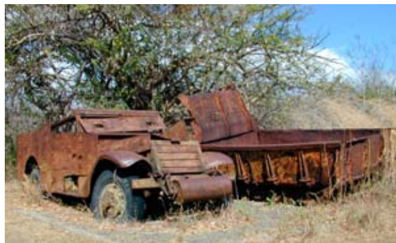
半世紀以上前に廃棄され、野ざらしになっている昔の装甲車(イメージ)